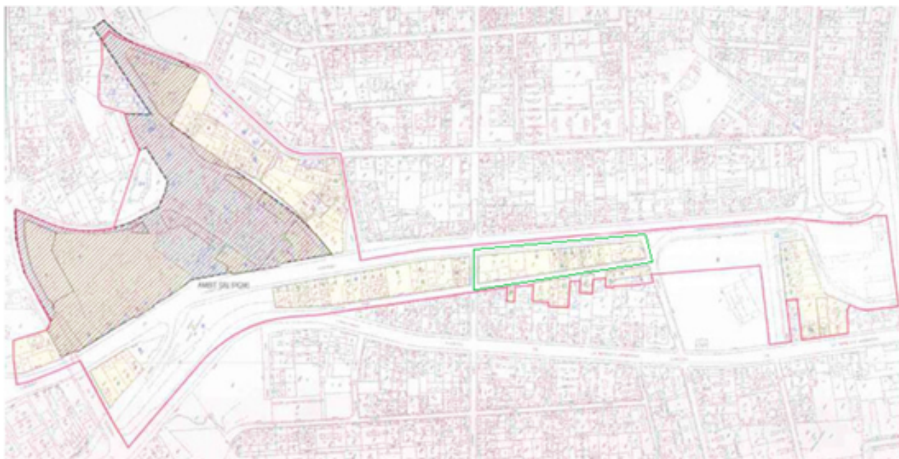
Figura 3. Casc antic i avinguda del barri de Vallcarca. La línia vermella mostra la zona afectada pel MPGM 2002; la línia verda mostra la zona actualment en disputa sobre el projecte d'avinguda verda.

Les modificacions al PMG del 2018 estipulen que les demolicions només afectaran la peça urbana que va des del carrer Agramunt fins a la casa modernista Comas d'Argemí, que inclou els següents espais d'importància comunitària: el celler La Riera, l'edifici okupat Old School i l'Ateneu Popular de Vallcarca.