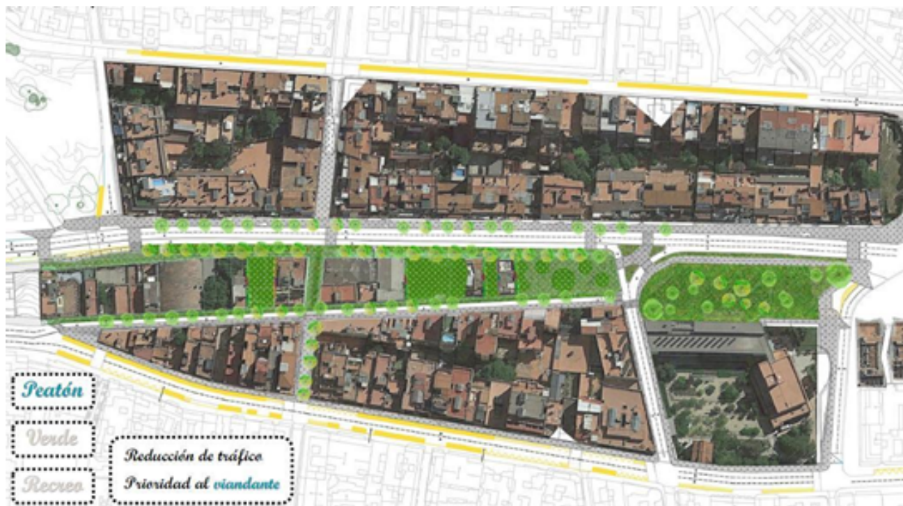
Figure 4. Alternative proposal from Som Barri for the green avenue of Vallcarca / XFDC

verdes i desincentivar els vehicles de motor, en lloc de desplaçar els veïns. En comptes d'enderrocar cases, proposen rehabilitar-les i introduir jardins verticals a les façanes.