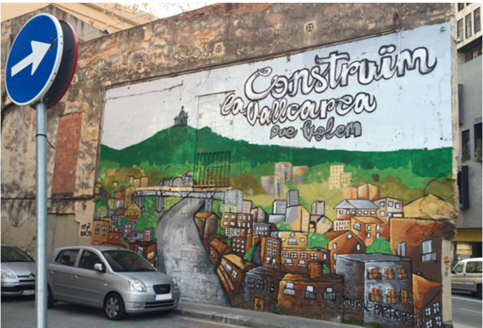
Figura 1. Graffiti vist a l'Avinguda de Vallcarca. El text diu: 'Construïm la Vallcarca que volem'.